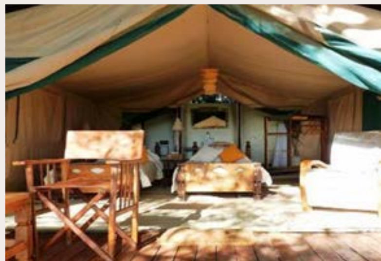
LAKE EYASI, KISIMA NGEDA TENTED CAMP