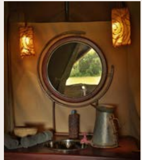
NGORONGORO, PAKULALA SAFARI CAMP