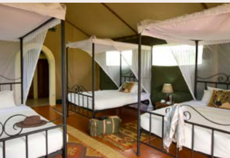
MANYARA, KIRURUMU LODGE