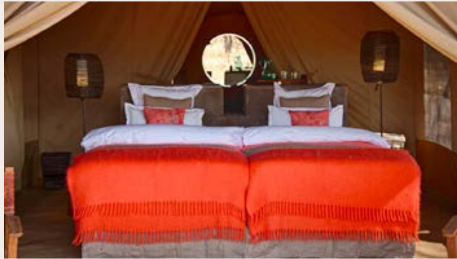
SERENGETI, PUMZIKA LUXURY SAFARI